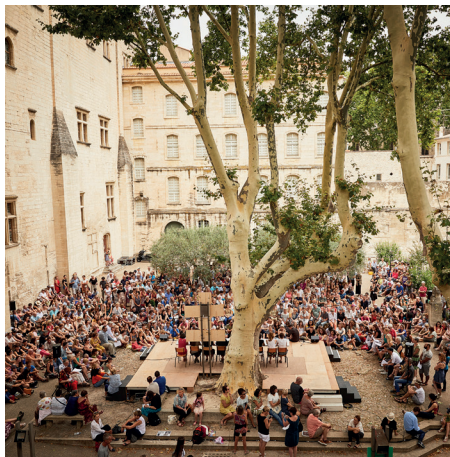
On aura tout, Cristiane Toubira et Anne-Laure Légeais, 2017

Les étudiants en formation initiale peuvent effectuer des stages sur le territoire national ou international.